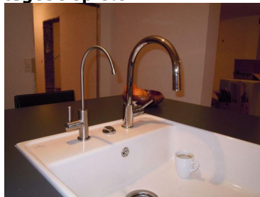
... AQUAPORIN -Auslasshahn (links)